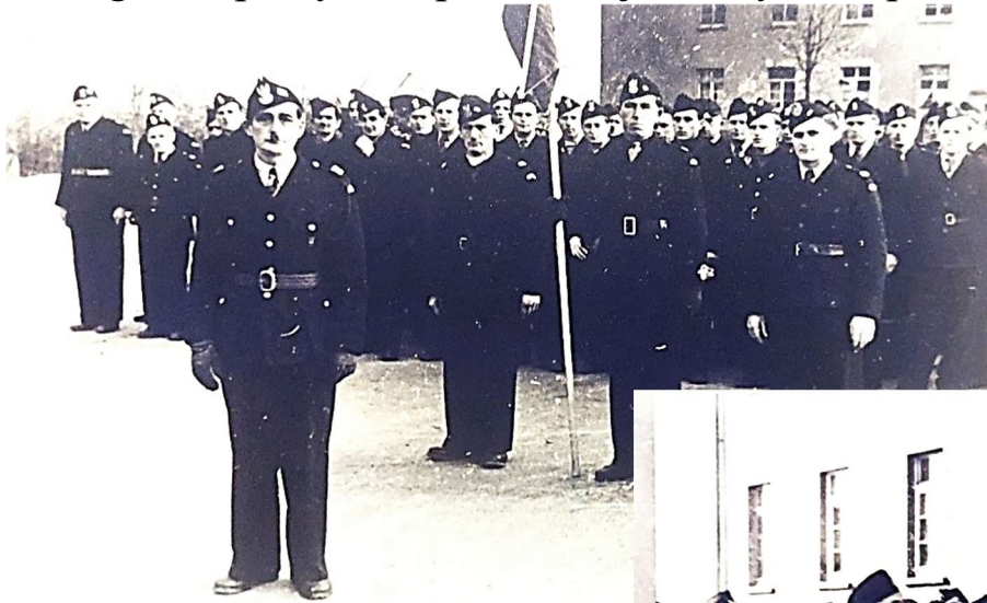
Kompania wartownicza przed blokami Priesterwaldkaserne.